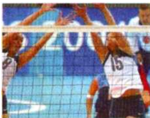
Trionfo Azzurre vittoriose